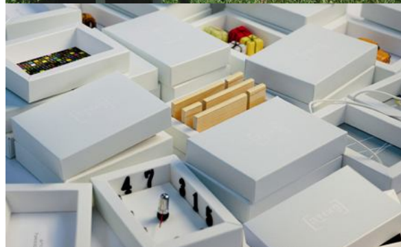
יסמין לוריא, סמינר הקיבוצים